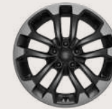
Rines de aluminio de 17" Neumáticos 225 / 60 R17 Neumático de refacción de tamaño normal