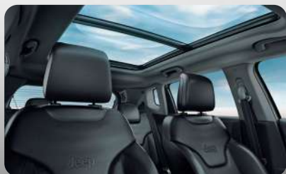
Quemacocos dual panorámico CommandView®