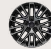
Rines de aluminio de 19" Neumáticos 235 / 45 R19 Neumático de refacción de tamaño normal