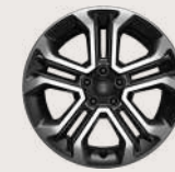
Rines de aluminio de 18" Neumáticos 225 / 55 R18 Neumático de refacción de tamaño normal