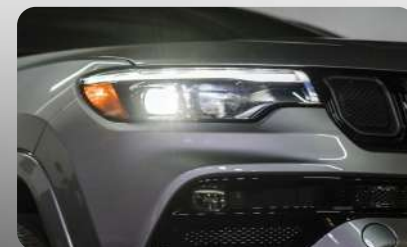
Faros delanteros LED de proyector