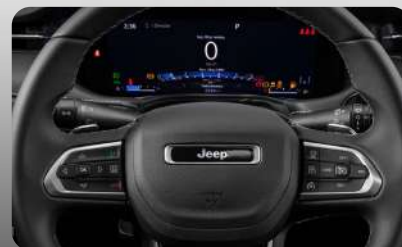
Cluster de 10.25"