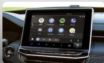
Sistema Uconnect® con pantalla táctil de 10.1" y conexión inalámbrica compatible con Android Auto™ y Apple CarPlay®