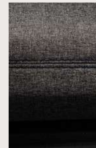
Interiores con acentos en color azul