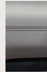
Interiores con acentos en color cobre